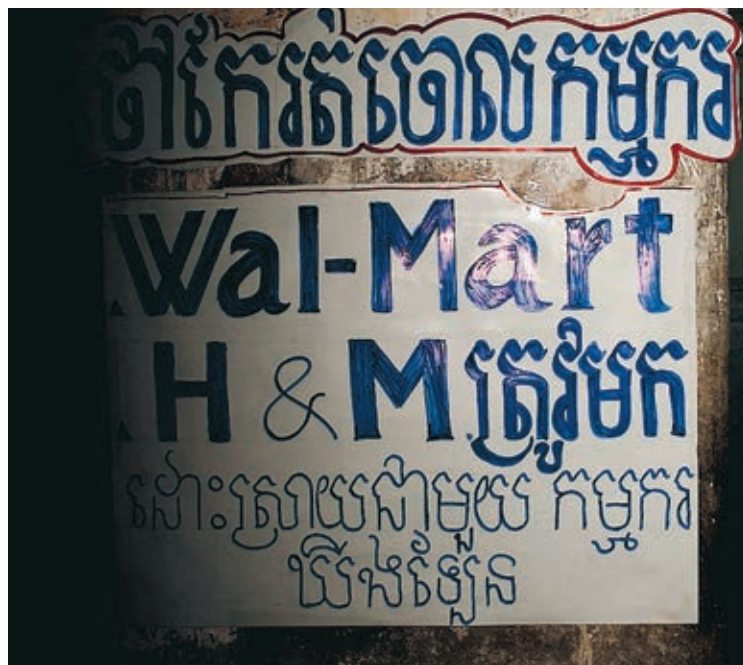
Textilarbetarna på Kingslands fabrik har sytt kläder för amerikanska Walmart och H&amp;M. På skylten uppmanas bolagen att ta sitt ansvar.