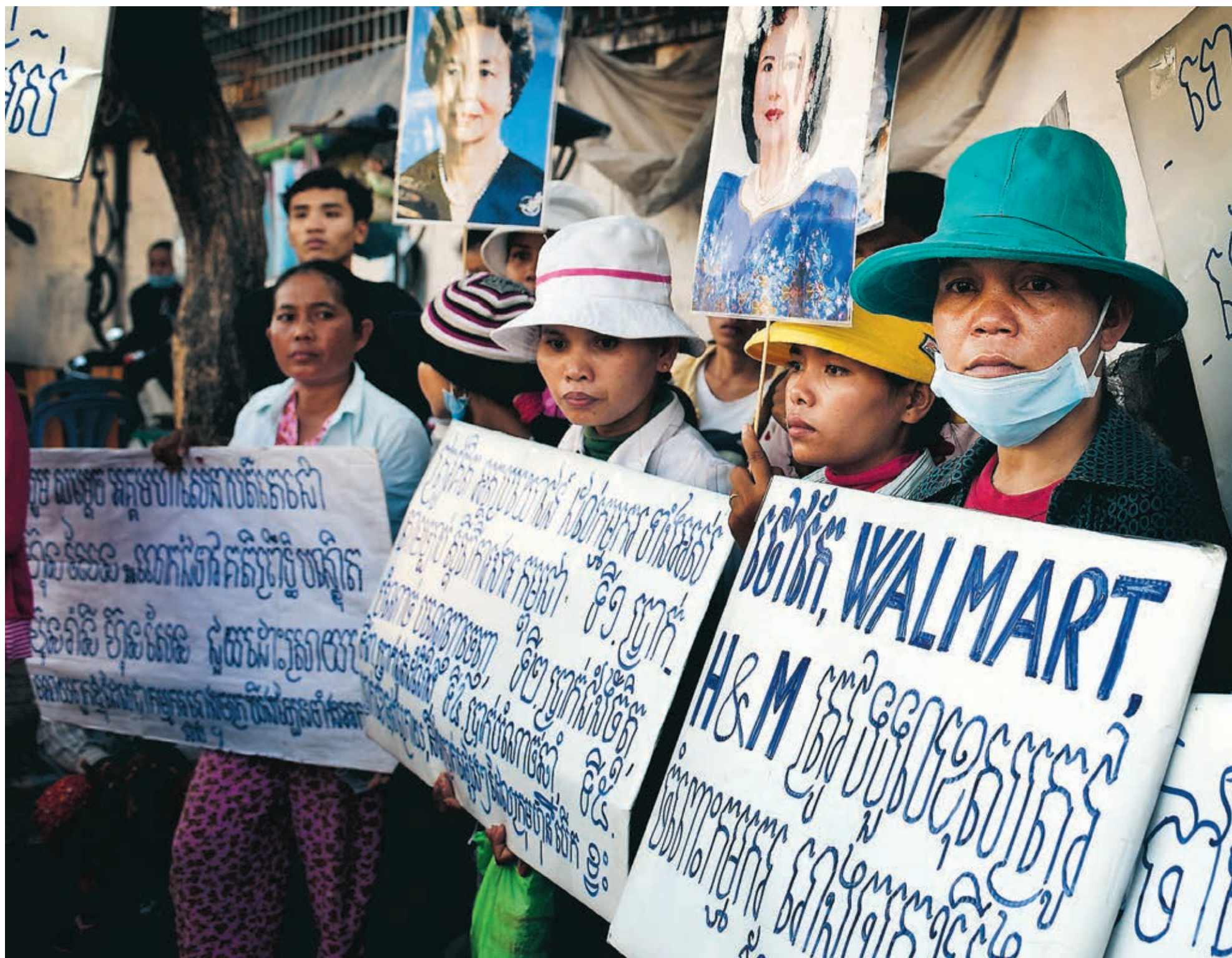
Textilarbetarna utanför bolaget Kingslands fabrik i Kambodja protesterar bland annat mot dåliga arbetsvillkor och oskäligen löner. På ett av deras plakat står det "Ägare av Kingsland fabrik, Walmart och H&M måste ta sitt ansvar och hitta en lösning för oss arbetare".