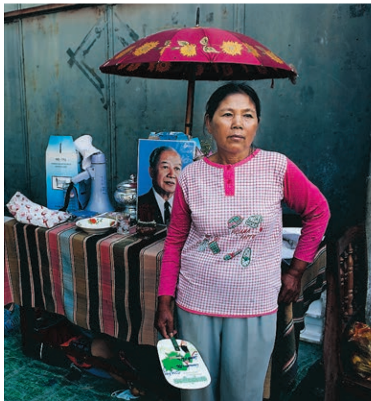
På Community Legal Education Centre, CLEC, jämför man de kambodjanska textilarbetarnas villkor med slaveri.